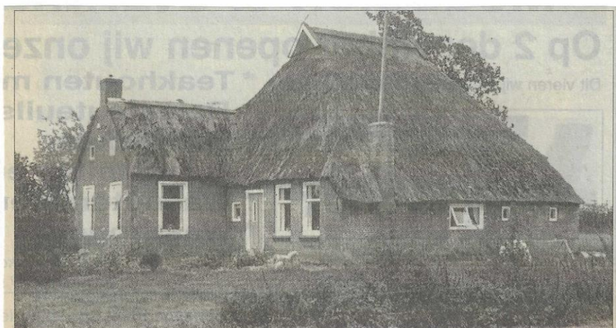
Pand Lytsewei 34, Drogeham, eigenaar/bewoner W. de Vries, afgebroken in 1955, op deze plaats werd later een bungalow gebouwd.