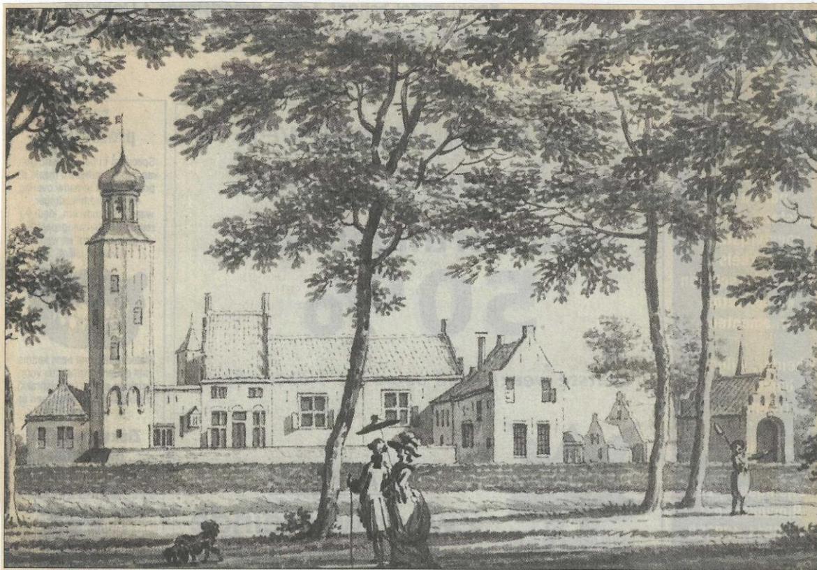
Tekening Tjaerdastate te Rinsumageest eind 18de eeuw door J. Bulthuis. Laatste bewoners de Rotte/van Asbeck, op afbraak verkocht in 1834.